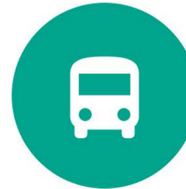
инфраструктура в доступности